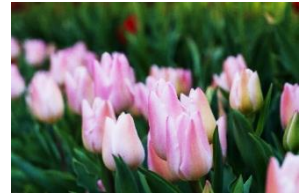
こんな風にチューリップが育つことを願っています。

水やりをしたりしてくれる生徒のボランティアを募集しています。たくさんの皆様のご協力をよろしく願います。