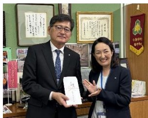
10月31日に、校長室で弘済会からの贈呈式を行いました

この度、公益財団法人日本教育公務員弘済会からチューリップとムスカリの球根合わせて550球が、教職員共済生活協同組合からチューリップの球根100球が寄贈されました。この球根を育てるため、球根を花壇やプランターに植えたり、