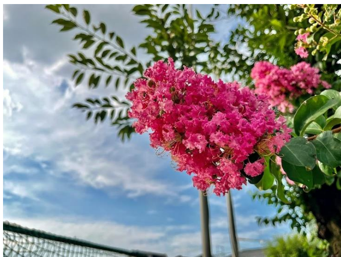
校庭のサルスベリ