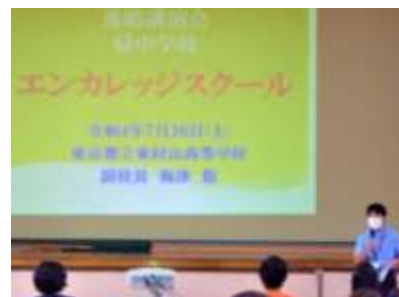
左上 野田鎌田学園杉並高等専修学校 右上 都立東村山高等学校 左下 都立世田谷泉高等学校

3校の先生方には、それぞれの学校の特徴や卒業までに取得できる資格、進路選択の際のポイント等をお話ししていただきました。ご準備くださりありがとうございました。