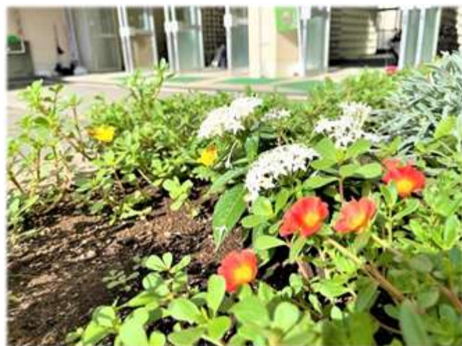
▲生徒昇降口前の花壇は、用務主事が季節に合わせて花を植えています。三者面談等で来校の際にご覧ください。