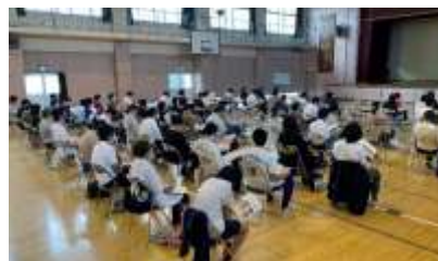
生徒も保護者の方も熱心に話を聞いていました。