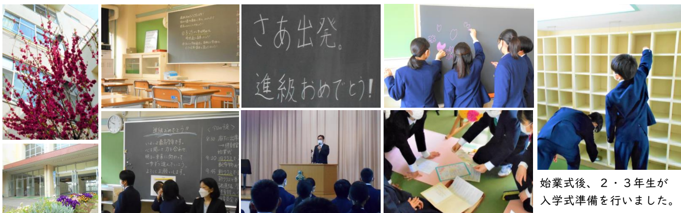
始業式後、2・3年生が入学式準備を行いました。